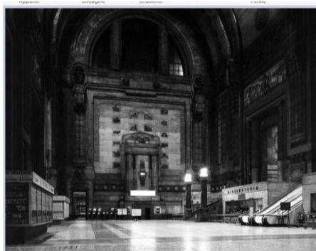
Interno stazione Centrale, 1950