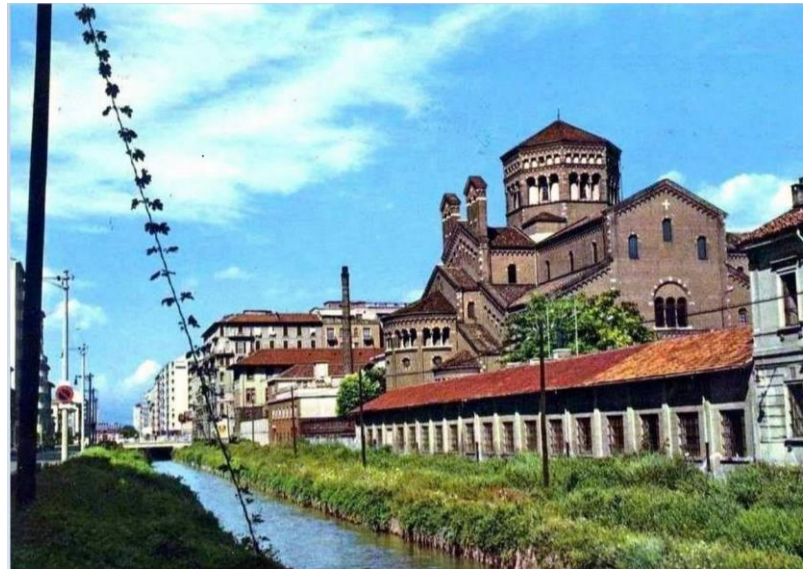
Via Melchiorre Gioia