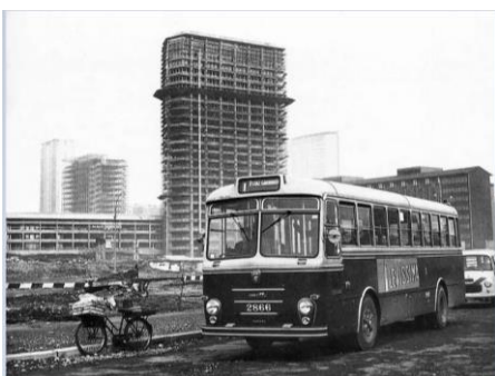
Viale Luigi Sturzo e il Centro Direzionale in costruzione, anni '60.