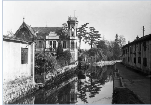
Villa Angelica-Naviglio Martesana