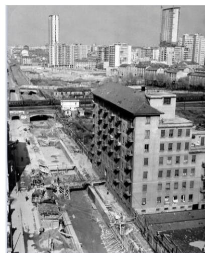
Lavori di copertura del naviglio Martesana