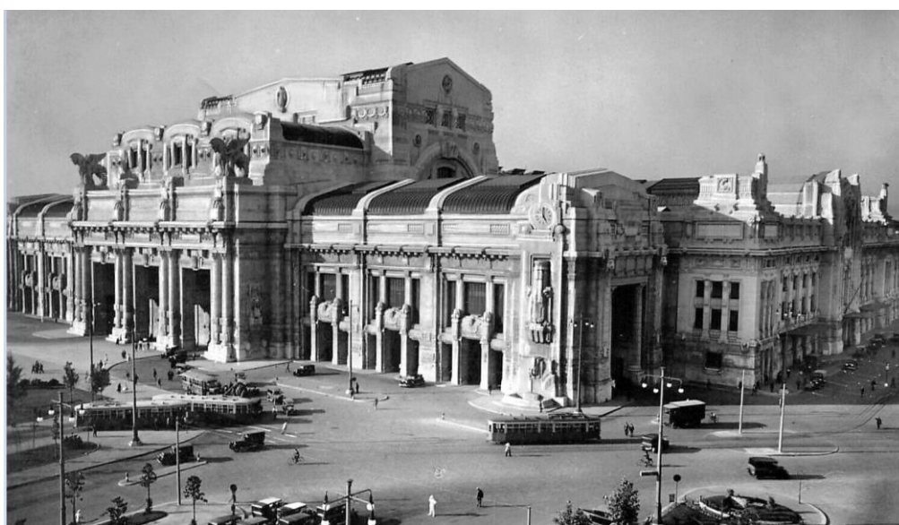
Stazione Centrale, 1930