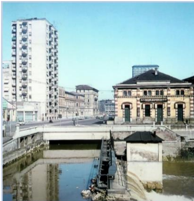
Tra via Melchiorre Gioia e viale Monte Grappa