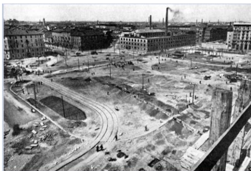
Piazza Duca d'Aosta durante i lavori per la costruzione della Stazione Centrale, anni '20