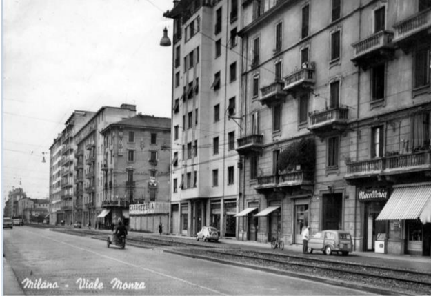
Viale Monza, 1950