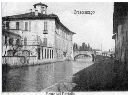
Crescenzago ponte naviglio