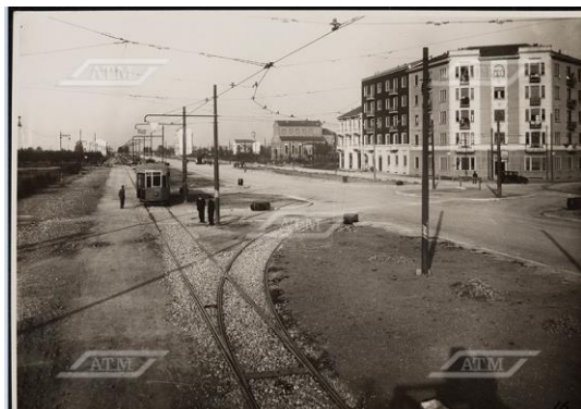
Fulvio Testi in costruzione 1931