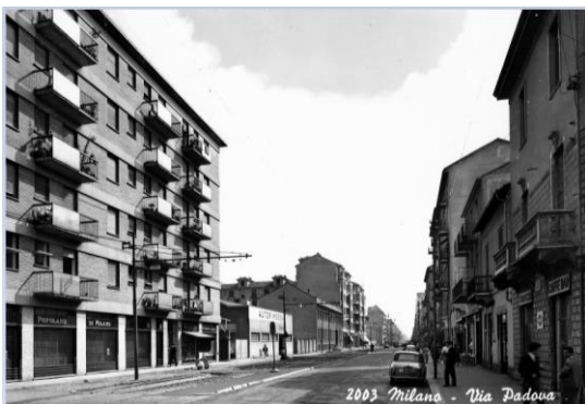
Via Padova, 1960