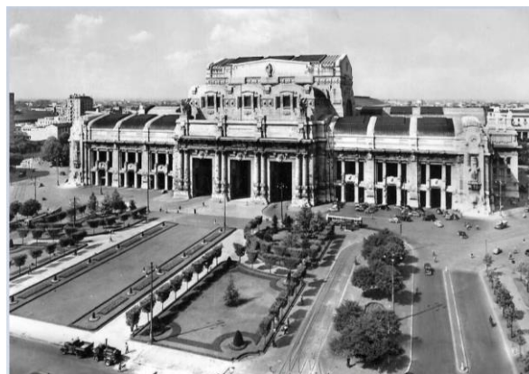
Stazione Centrale, 1950