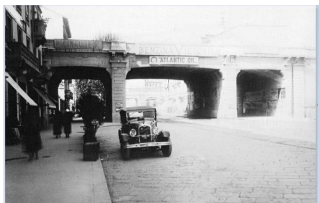
Viale Monza, 1920