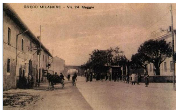
Greco milanese 24 maggio