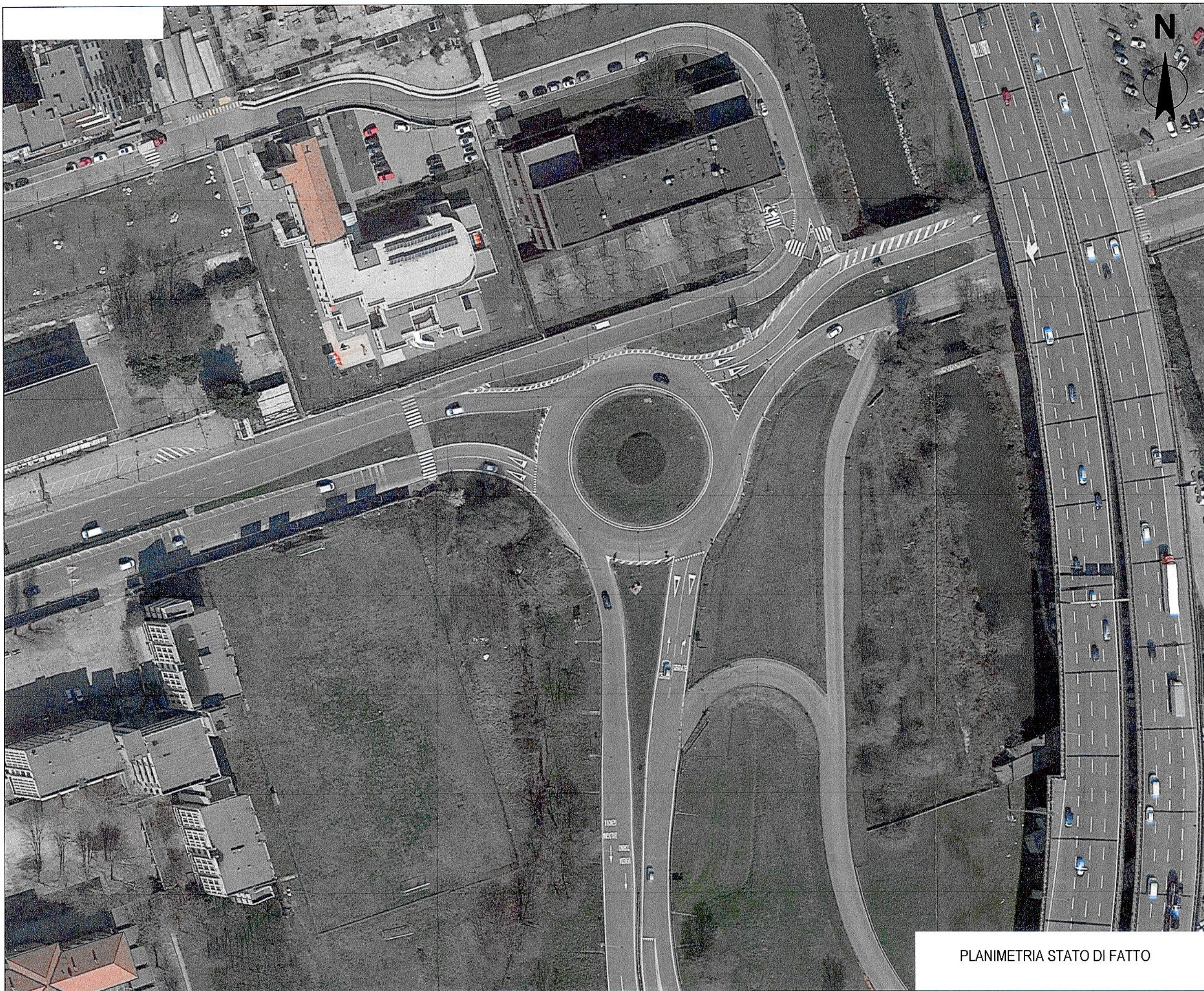
PLANIMETRIA STATO DI FATTO