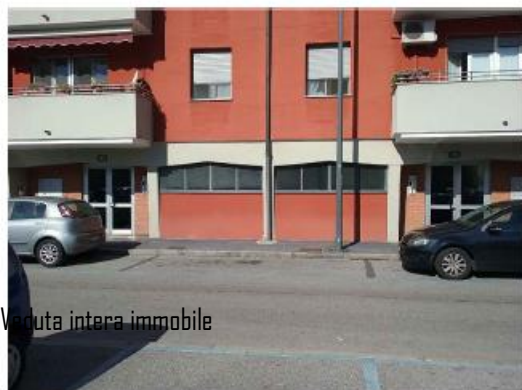
Visuale intera immobile