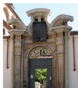
Civico Museo Archeologico