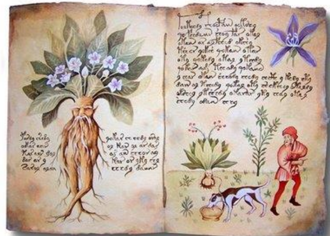
Plantas Medicinales 1095-1314