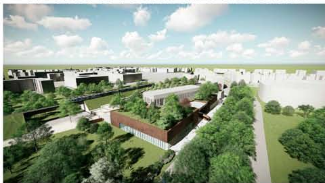
VISTA AEREA DA VIALE TOSCANA