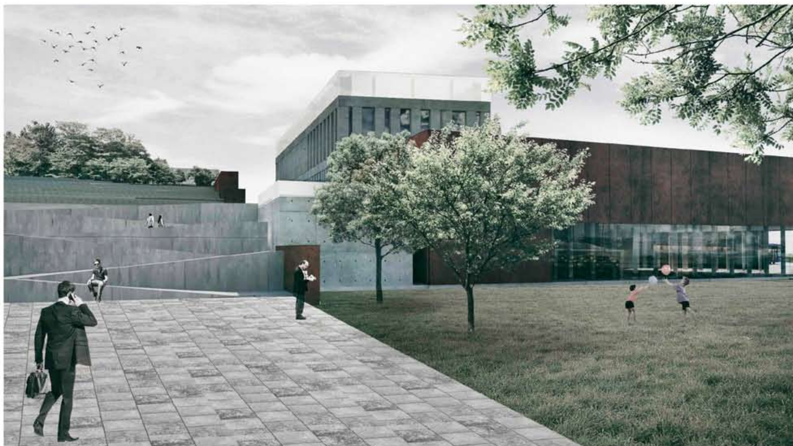
VISTA EST - VIALE TOSCANA