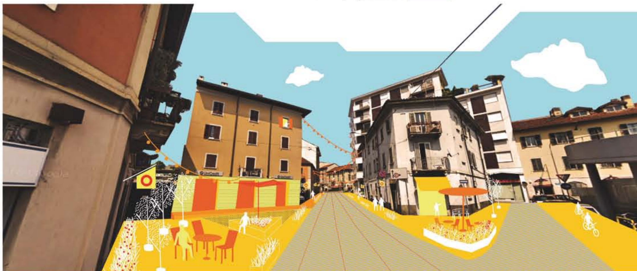
VIA ORNATO | Ipotesi di intervento sull'asse storico del quartiere con l'arredo e la riattivazione degli spazi pubblici