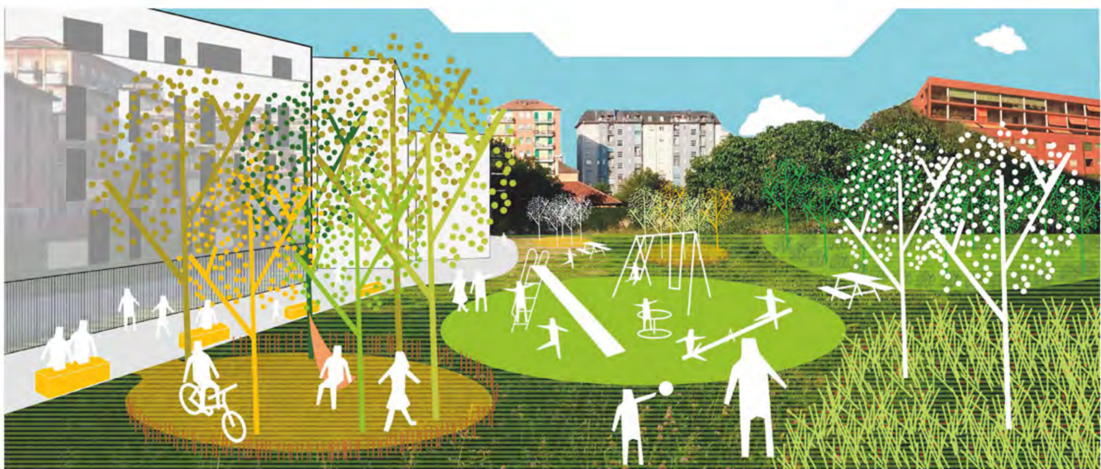
GIARDINO EX VILLA TROTTI | Ipotesi di intervento nell'area Villa Trotti con la creazione di un nuovo parco attrezzato