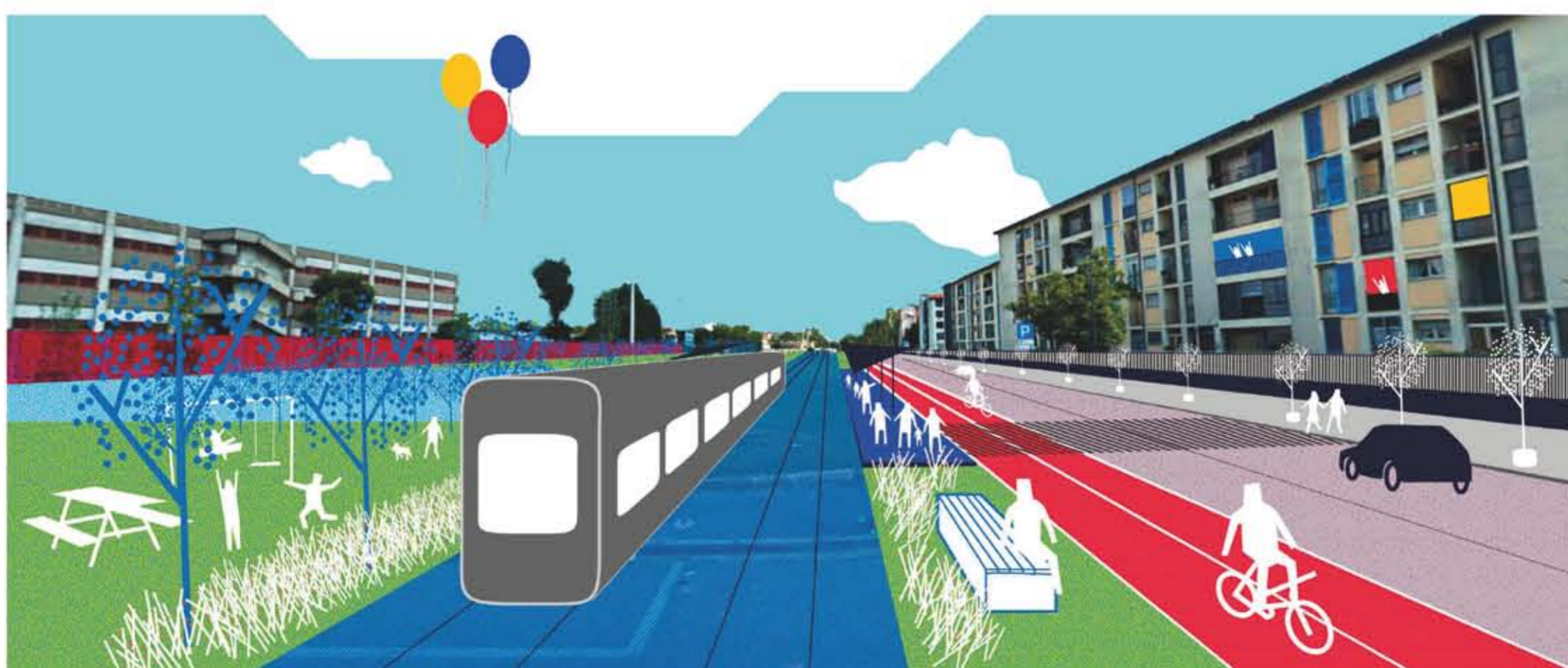
VIA RACCONIGI | Ipotesi di intervento con l'inserimento del doppio senso di marcia, di una nuova linea tramviaria e della pista ciclabile