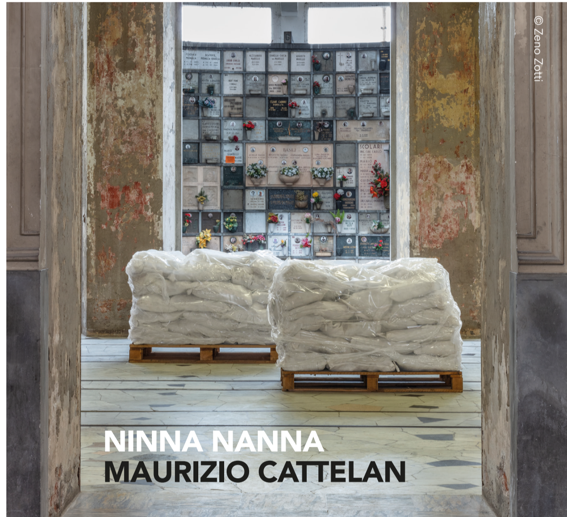
NINNA NANNA MAURIZIO CATTELAN