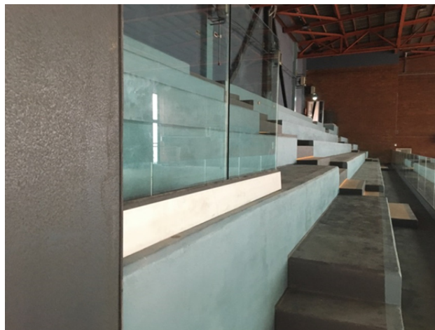
Le nuove tribune