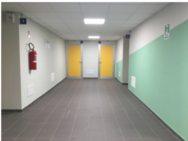
Uso dei colori per facilitare l'orientamento

Un'attenzione particolare, quella per l'accessibilità, che ha superato la semplice applicazione delle regole tecniche e grazie al supporto di associazioni di categoria ha reso il Centro Sportivo un modello all'avanguardia in Italia.