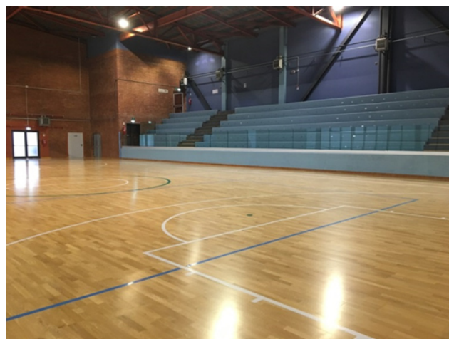
La Palestra Giordani