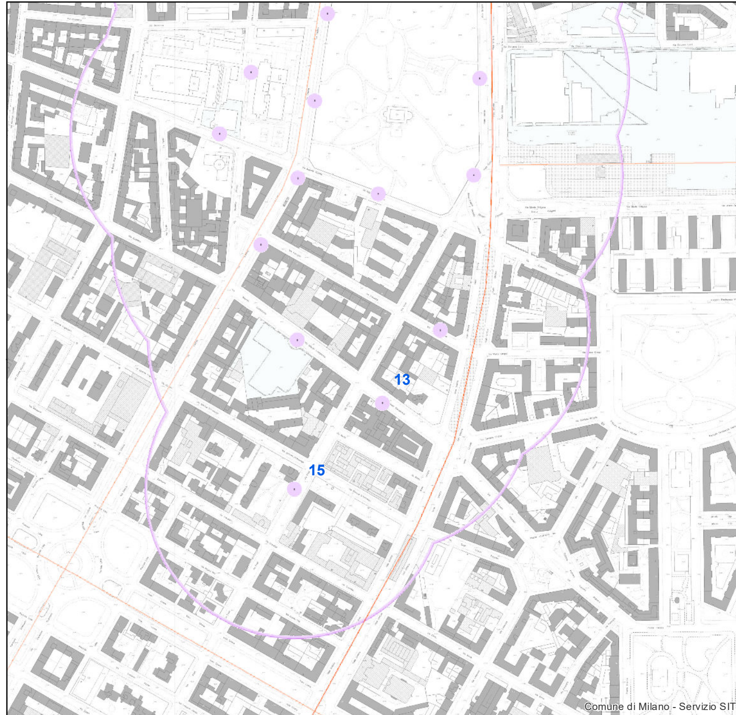
Stralcio della Tav. R05 | Vincoli amministrativi e per la difesa del suolo - MODIFICATO