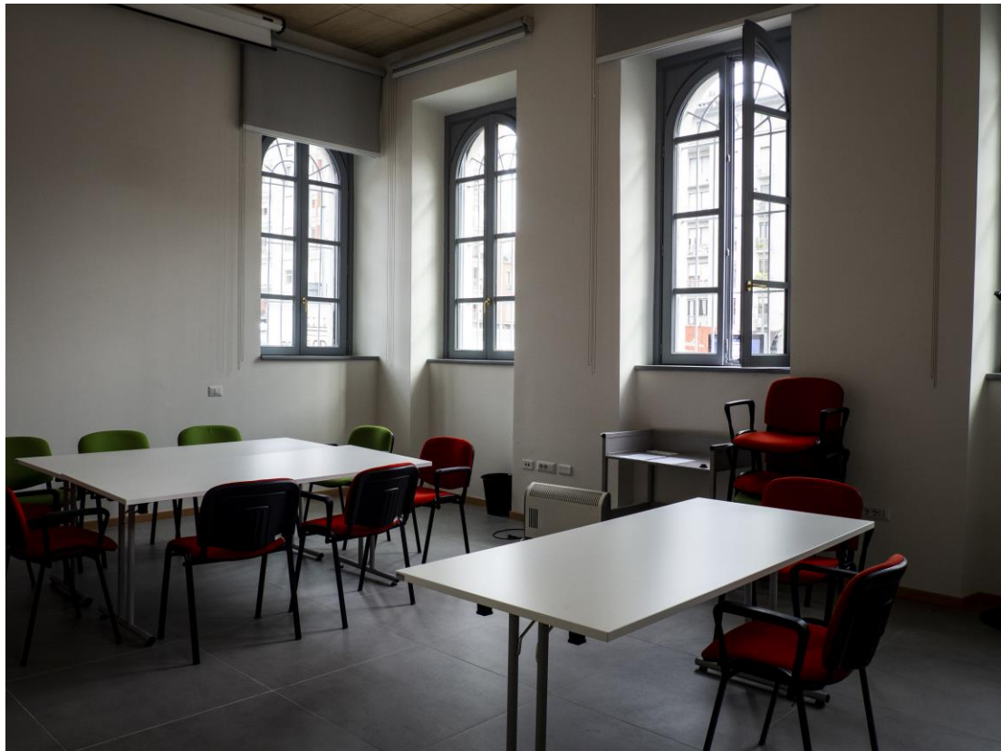
Foto 3. Salone