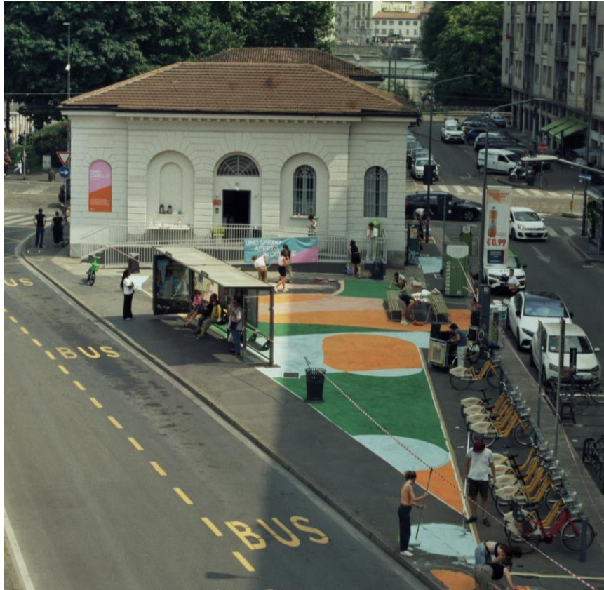
Foto 1. Vista frontale di Open Casello e della piazza tattica